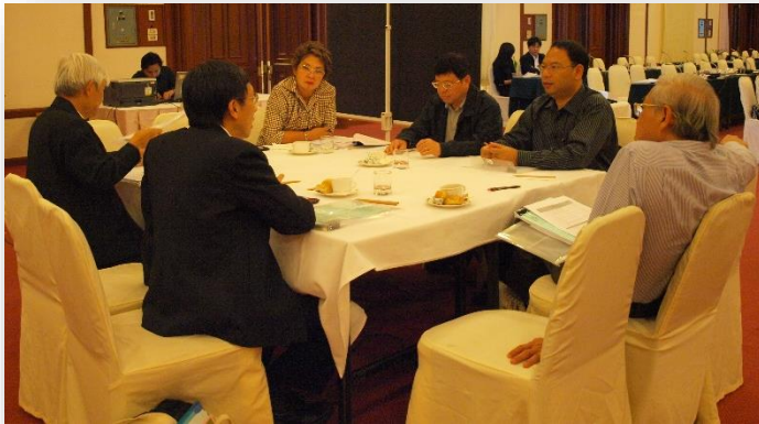
กรรมการสภามหาวิทยาลัย ผู้ทรงคุณวุฒิร่วมประชุมกับ ผู้บริหารมหาวิทยาลัย