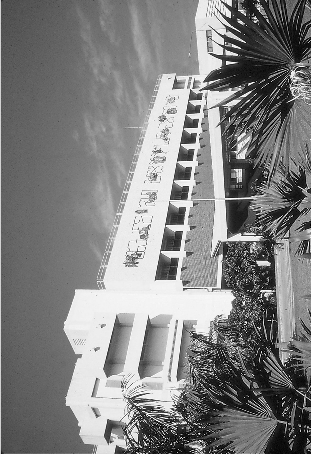
ที่ทำการมหาวิทยาลัยสุโขทัยธรรมมาธิราช ถนนแจ้งวัฒนะ ตำบลบางพูด อำเภอปากเกร็ด จังหวัดนนทบุรี