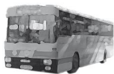
รถประจำทาง