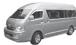
รถตู้ อนุสาวรีย์ชัยสมรภูมิ - เมืองทอง