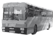
รถประจำทาง