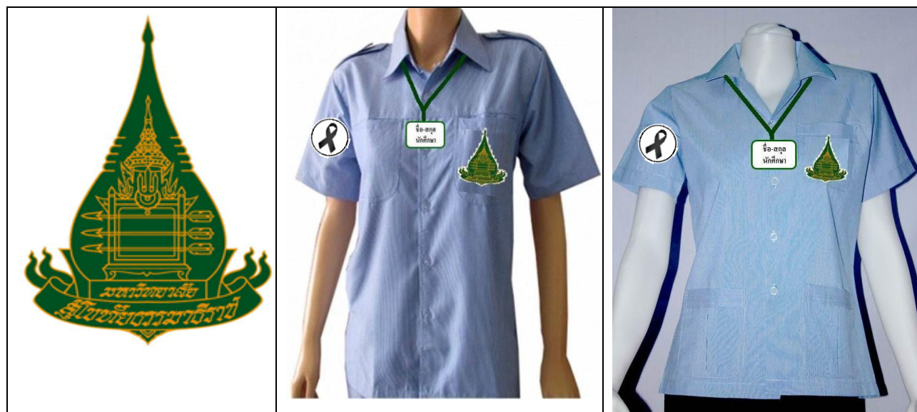
ภาพที่ 1 การแต่งกายนักศึกษาชาย - หญิง

ชุดวิชานี้กำหนดให้นักศึกษาชายและหญิงสวมเสื้อเครื่องแบบเจ้าหน้าที่สาธารณสุขสีฟ้าติดตรามหาวิทยาลัยสุโขทัยธรรมาราช (นักศึกษาสามารถหาซื้อได้ที่สหกรณ์ร้านค้า มสธ.) มาสอยติดกระเป๋าสีเสื้อด้านซ้าย รวมทั้งแขนซ้ายชื่อบัตรนักศึกษาพลาสติกห้อยคอนักศึกษา และสวมกางเกงขายาว ทรงสแลคสีด้า สวมรองเท้าหุ้มส้น และติดริบบิ้นสีดำ หรือเข็มกลัดเพื่อไว้อาลัย ในการฝึกปฏิบัติ (ดังภาพที่ 1)