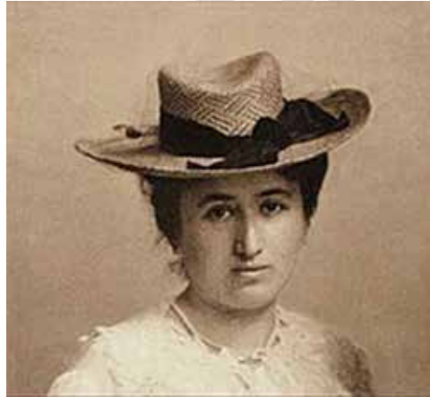
ภาพที่ 14.4 โรซา ลักเซมเบอร์ก (Rosa Luxemburg)