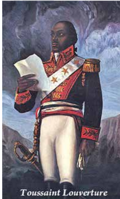
ภาพที่ 14.3 ตูสแซงต์ ลูแวร์ตูร์ (Toussaint L'Ouverture) ผู้นำการปฏิวัติของเฮติ ฉายา นโปเลียนผิวดำ (Black Napoleon)

สร้างเสถียรภาพให้กับการเมืองภายใน และหวังสร้างโอกาสทางเศรษฐกิจ 42 สงครามนโปเลียนจึงเป็นเสมือนส่วนขยายของสงครามปฏิวัติดังกล่าว ที่มีแง่มุมผลประโยชน์ด้านเศรษฐกิจเข้ามาเกี่ยวข้องมากยิ่งขึ้น