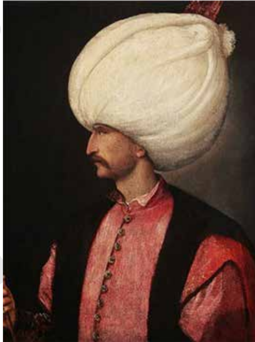
ภาพที่ 14.1 สุลต่านสุไลมาน (Suleiman the Magnificent) ผู้ผลักดันการขยายตัวของจักรวรรดิออตโตมานจนเป็นประตูเชื่อมต่อดินแดนตะวันออกและตะวันตก

จักรวรรดิออตโตมาน 3 ในยุครุ่งเรืองอย่างที่สุดออตโตมานครอบครองพื้นที่รอบทะเลเมดิเตอร์เรเนียน ที่ราบสูงอานาโตเลีย ตะวันออกกลาง บางส่วนของแอฟริกา และยุโรปใต้ นี่คือนักรวรรดิที่ประกาศตนเป็นจักรวรรดิมุสลิมซุนนี (Sunni Muslim) เมื่อช่วงต้นคริสต์ศตวรรษที่ 16 แม้จะมีได้เป็นเชื้อสายอาหรับแบบเดียวกับท่านศาสดา 4