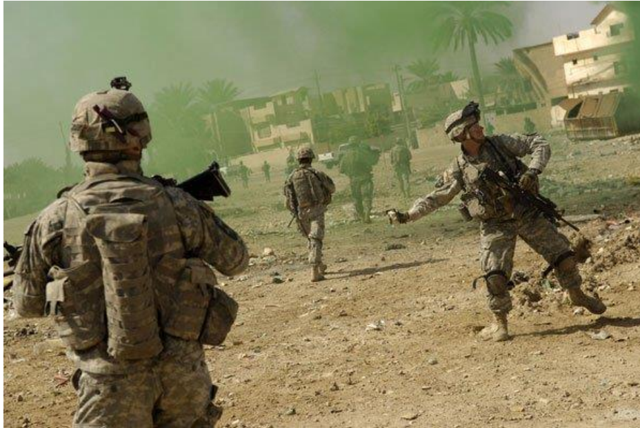
ภาพที่ 3.4 แสดงความขัดแย้งที่เป็นความรุนแรงในอิรัก (violent conflict)

มั่นคงของมนุษย์ ได้แก่ ความขัดแย้งภายในรัฐและรัฐล้มเหลว อาชญากรรมข้ามชาติ การแพร่ขยายของอาวุธที่มีอำนาจการทำลายล้างสูง ความขัดแย้งทางศาสนาและชาติพันธุ์ ความเสื่อมโทรมของสิ่งแวดล้อม การเพิ่มขึ้นของจำนวนประชากร การอพยพ การกดขี่จากรัฐ การใช้ทุนระเบิดสังหารบุคคล การล่วงละเมิดเด็ก การด้อยพัฒนาทางเศรษฐกิจและการกีดกันทางการค้าระหว่างประเทศ