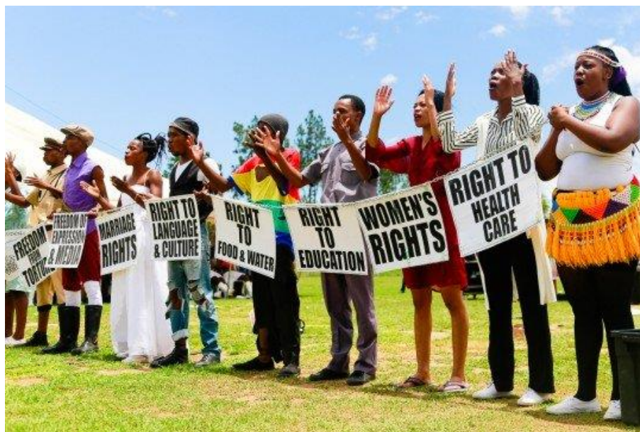
ภาพที่ 3.3 แสดงกิจกรรมของโครงการพัฒนาแห่งสหประชาชาติ (UNDP) ซึ่งส่งเสริมและสนับสนุนสิทธิมนุษยชนในซิมบับเว