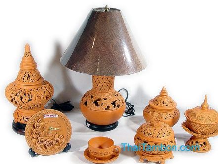
ตัวอย่างรูปแบบผลิตภัณฑ์เครื่องปั้นดินเผาพื้นเมืองบ้านเกาะเกร็ด