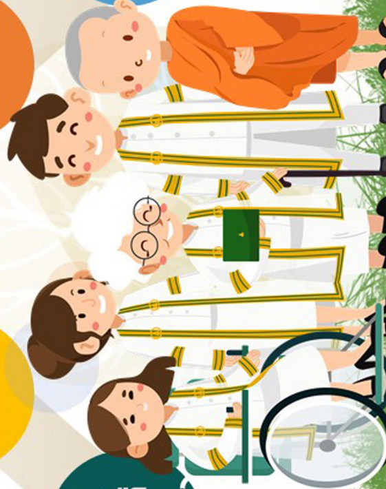
Cartoon Design by Aeri

ปรับตัวได้ กับเปลี่ยนแปลง และเทคโนโลยีดิจิทัล